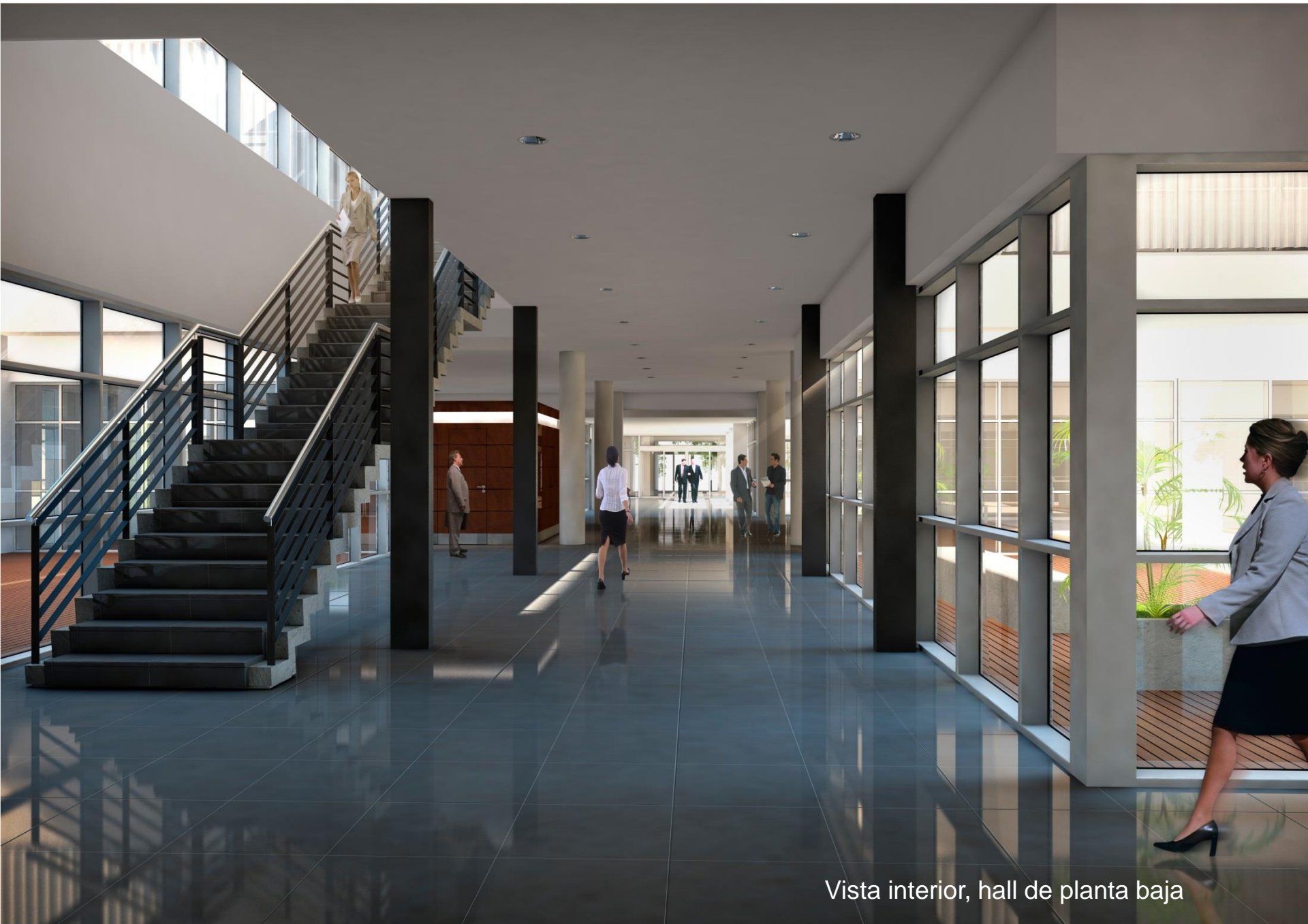
Vista interior, hall de planta baja