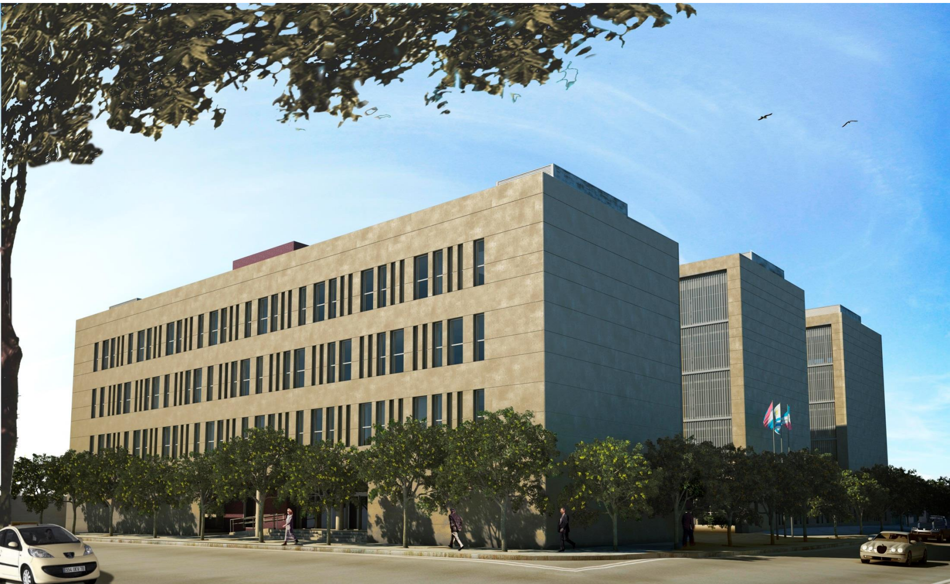
Vista desde Florida y Solís