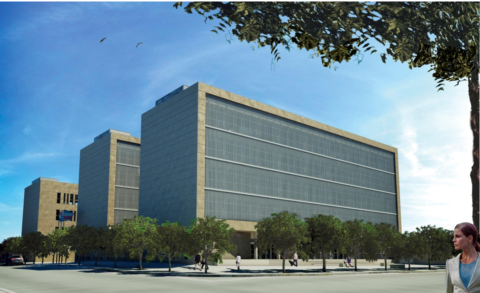
Vista desde Florida y Zelmar Michelini