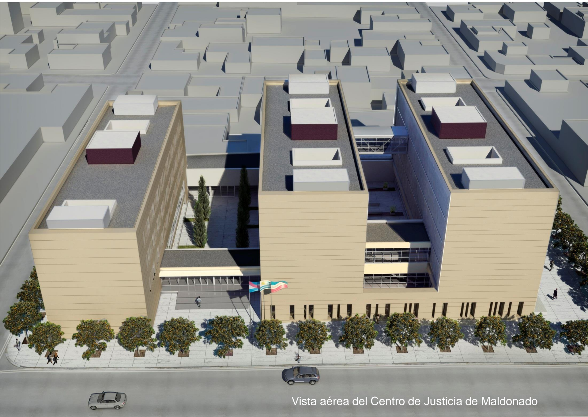
Vista aérea del Centro de Justicia de Maldonado